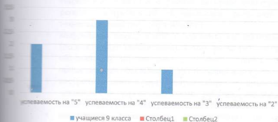
Успеваемость обучающихся 9 класса

В аттестат об основном общем образовании всем обучающимся была выставлена годовая оценка. Качество знаний и успеваемость выпускников 9 классов по итогам государственной итоговой аттестации отражено в диаграмме.